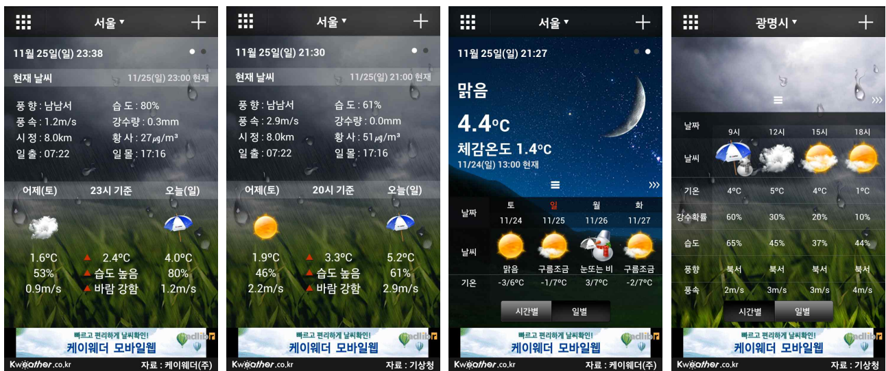
[그림] 케이웨더 예보 및 기상청 예보 선택 화면